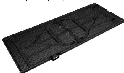
Fig. 2 – Mesa abierta