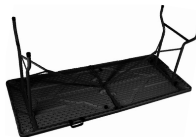
Fig. 4 – Mesa abierta