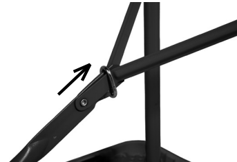
Fig. 5 – Argola de travamento das hastes