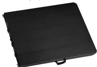
Fig. 1 – Mesa cerrada