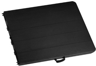
Fig. 1 – Mesa fechada