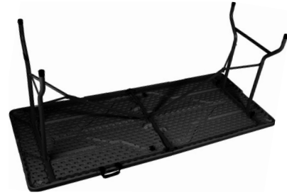
Fig. 4 – Mesa aberta