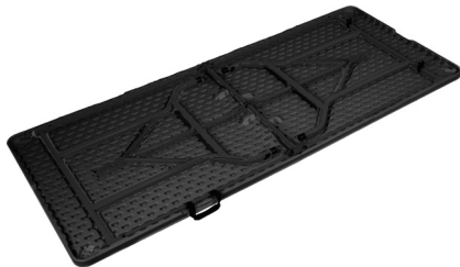
Fig. 2 – Mesa aberta