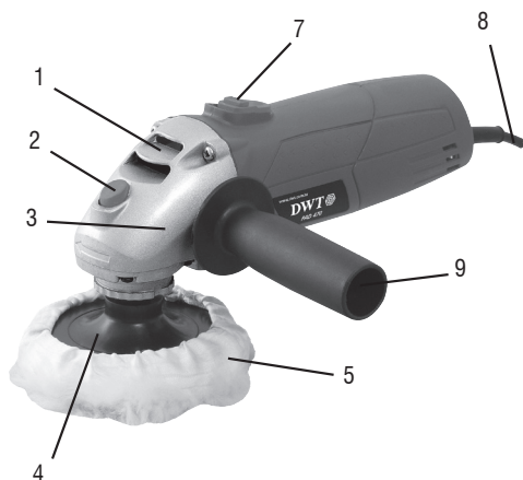
Fig. 1 – Componentes