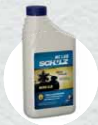
Óleo Lubrificante MS LUB 1 litro 010.0011-0