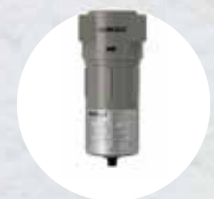
Elemento Filtrante 028.0971-0/AT

Use acessórios Schulz para melhor aproveitamento do seu compressor: