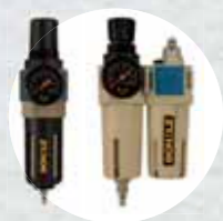
Filtro FR/FRL FR: 926.6018-0 FRL: 926.6015-0