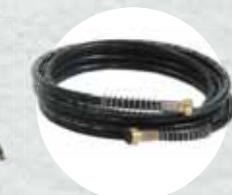
Mangueira para Ar Comprimido 5 m: 028.0399-0; 10 m: 028.0396-0 15 m: 028.0395-0