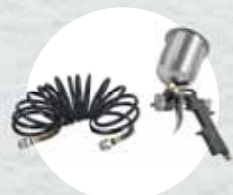
Compact Kit 3 peças 809.1103-0