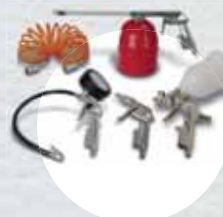
Air Kit 5 peças 809.1039-0