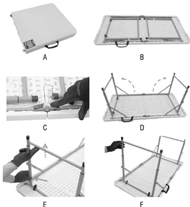
Fig. 1 – Montagem da mesa dobrável