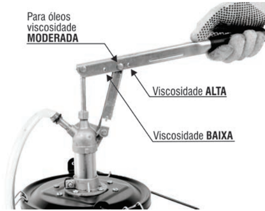
Fig. 2 – Ajuste conforme viscosidade do fluido