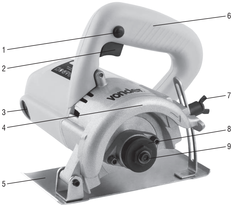
Fig. 1 – Componentes del herramienta