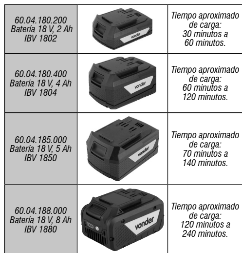
Tabla 3 – Baterías intercambiables VONDER

VONDER ofrece varios modelos de baterías al mercado. Son ellas: