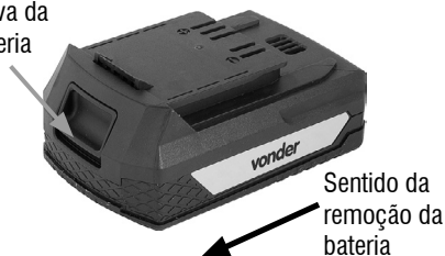
Fig. 1 – Retirando a bateria

Para carregar a bateria, retire-a do equipamento e conecte-a ao carregador, como mostra a Figura 2. Conecte o plugue do carregador na tomada.