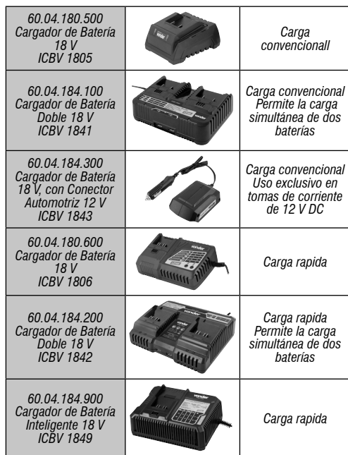
Tabla 4 – Cargadores de baterías intercambiables VONDER

VONDER ofrece varios tipos de cargadores al mercado. Son ellos: