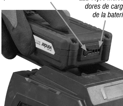
Fig. 2 – Cargador

LED rojos Indicadores de carga de la batería