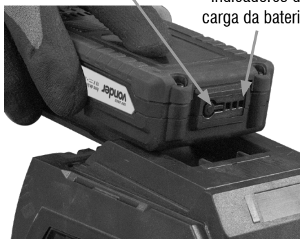
Fig. 2 – Carregador

LEDs vermelhos indicadores de carga da bateria