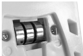
3 baterias, 1,5 V