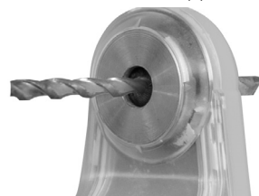
Fig. 3 – Abertura da broca