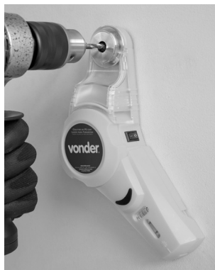
Fig. 4 – Realizando a perfuração