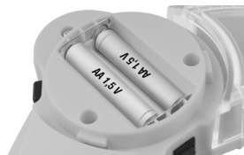
Fig. 7 – Troca das pilhas (2 pilhas AA, 1,5 V)