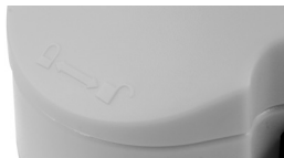
Fig. 6 – Tampa do compartimento da pilha