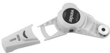
Fig. 2 – Uso do laser separadamente