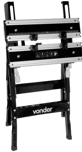
Figura 5 – Dimensiones (cerrada)