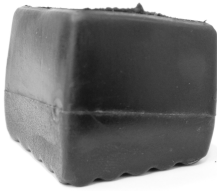
Figura 2 – Lado puntiagudo

7. Encaje los pies (13) en las patas (2). El lado puntiagudo del pie debe estar fuera del banco multiusos.