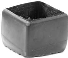
Figura 3 – Lado bajado

El lado bajado debe estar en el interior del banco multiusos.