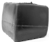
Figura 2 – Lado pontiagudo

O lado rebaixado deve ficar no lado de dentro da bancada multiuso.