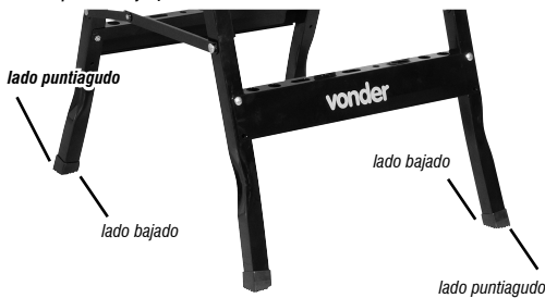
Figura 4 – Montaje de los pies de goma

A continuación, coloque y presione la estructura metálica hasta que encaje perfectamente.