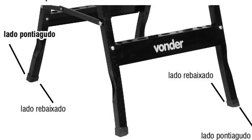
Figura 4 – Montagem dos pés de borracha

Após isto, posicionar e pressionar na estrutura de metal até o seu perfeito encaixe.