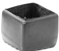
Figura 3 – Lado rebaixado

O lado rebaixado deve ficar no lado de dentro da bancada multiuso.