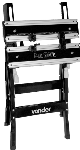
Figura 5 – Dimensões (fechada)